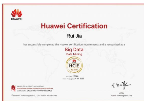
图 3 教师获得华为大数据专家级工程师认证

我司与学校紧密配合，以华为工程师认证为驱动，建立辽宁交专-华为 ICT 产业学院“双师”教师能力标准，提供华为公司先进的技术资源和优质的职业教育教学资源，与校内教师协同共同建设课程资源，共同完成教学过程，实施课堂学习与企业案例实训交替进行，培育专业融合、技术领先、理论与实战经验丰富的双师型团队。三年来，为学校培养师资 28 人，全部通过华为工程师与 ICT 学院讲师认证。