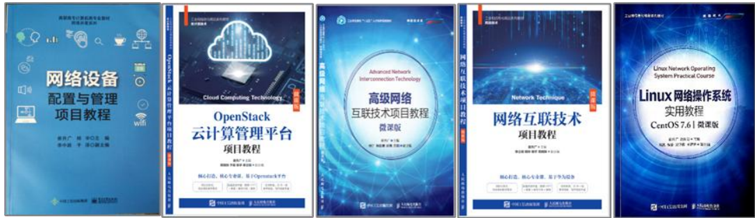
图 5 校企合作开发特色化教材