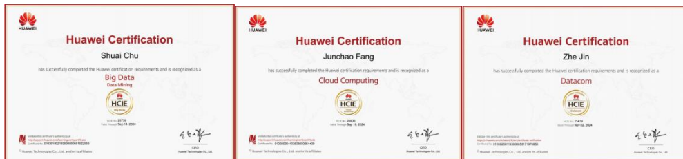
图9 学生获得华为专家级工程师认证

以高标准育人、高质量就业为目标，我司开展“华为卓越实验班”专项培养，培养数通、云计算、大数据三个方向的华为专家级工程师。截止目前，已有41名同学获得华为专家级工程师，其中云计算方向14名、大数据方向10名、数通方向2名、人工智能方向15名。为辽宁省首批获得此认证的高职在校学生，整体数量和质量在全国处于领先地位，形成示范性效应。