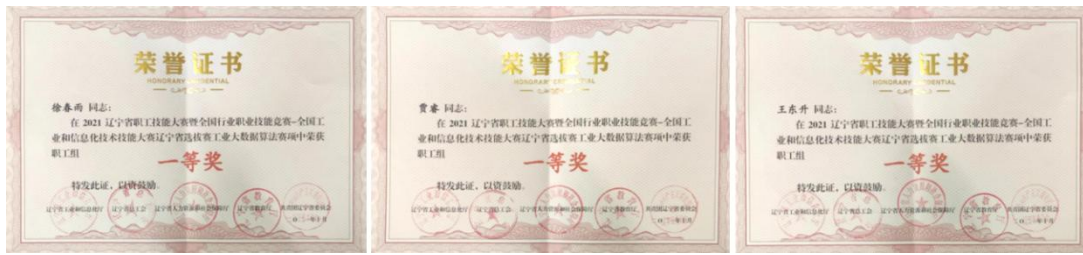
图 10 教师获得技能大赛奖项