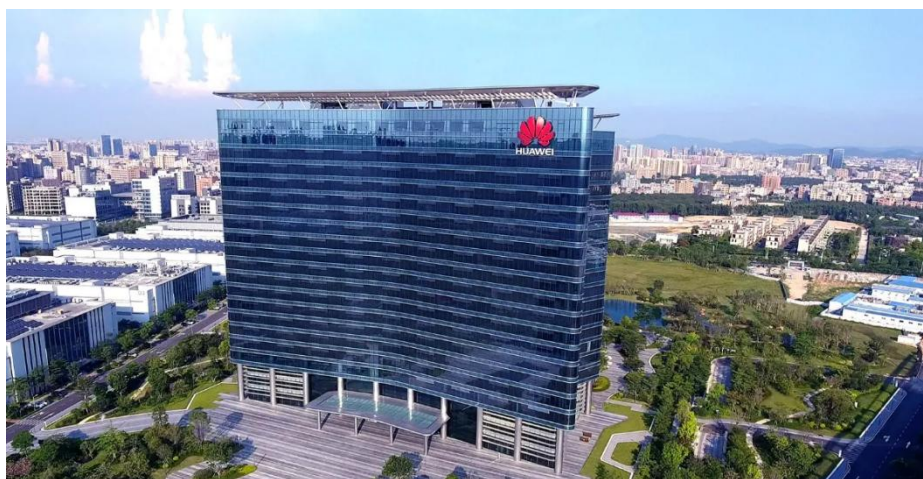
图1 华为技术有限公司

愿景、使命与战略：华为致力于把数字世界带入每个人、每个家庭、每个组织，构建万物互联的智能世界：让无处不在的联接，成为人人平等的权利；让无所不及的智能，驱动新商业文明；所有的行业和组织，因强大的数字平台，而变得敏捷、高效、生机勃勃；个性化的定制体验不再是少数人的专属特权，每一个人与生俱来的个性得到尊重，潜能得到充分的发挥和释放。