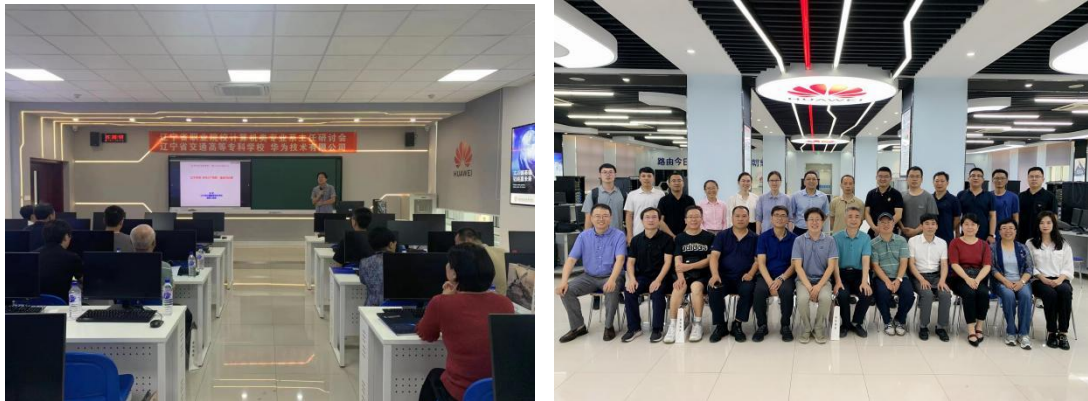
图 7 辽交&华为合作举办计算机类专业系主任研讨会

同育人是推进高职教育教学改革，提升人才培养质量，促进企业快速升级发展的双赢举措。