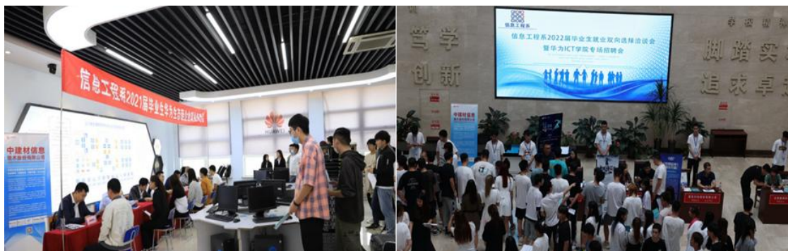
图 2 华为生态链企业专场就业双选会

多年来，我司在产教融合政策指引下，一直积极探索与辽宁省交通高等专科学校开展校企合作育人，针对辽沈地区 ICT 产业业务领域分工与人才需求特点，确定了“一校多企、标准统一”定制人才培养方式。我司牵头搭建基于生态链企业的人才供需对接与就业服务平台，每年 10 月中旬，与辽宁省交通高等专科学校毕业生以双向选择、实习带就业的方式接纳学生到相关企业顶岗实习。以华为工程师任职能力为标准，为实习学生配置企业导师，对应开发了模块化、阶梯化课程资源，实行进阶式培养，提升学生的职业意识和专业能力。