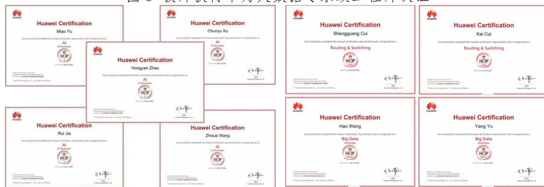
图 4 教师获得华为大数据专家级工程师认证

我司参与编制并优化了云计算、人工智能、大数据等 5 个专业人才培养方案，制定专业核心课程标准 25 门，编辑出版特色教材 5 本，被省内外多所院校选用与参考。